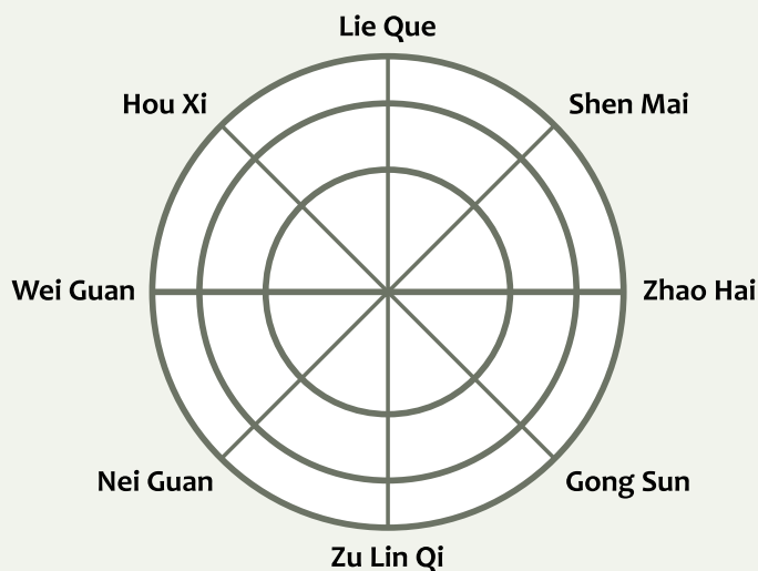
Сочетающиеся пары точек

При укалывании лишь одной из этих пар точек автоматически «открываются» все остальные «шлюзы» акупунктурных проводников, и включается внутренний механизм ауторегуляции Qi et Xue, как это и представлено нами выше. Почему так, а не иначе?